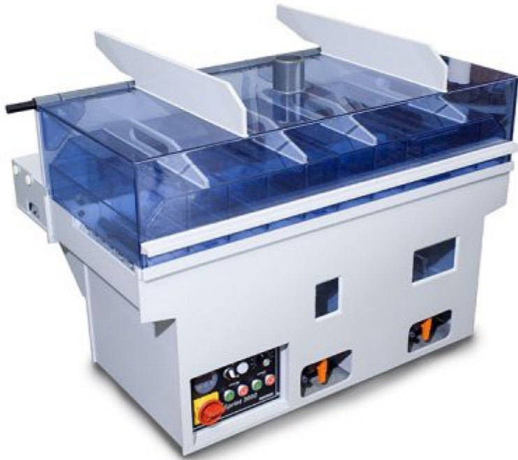
Sprint 3000 mit zusätzlicher Absaughaube (Option)