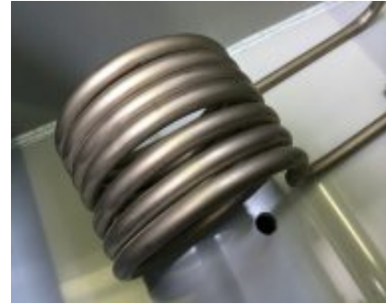
Unterschiedliche Material Dicken möglich (Option)