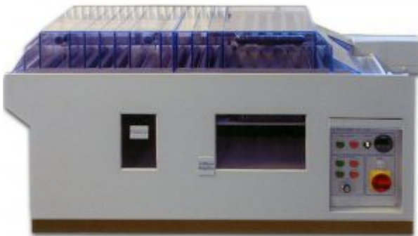
Sprint4500 Durchlaufbreite 450 mm

Neu! Die Typenreihe Sprint (3000/4500/6000) ist zur Fertigung doppelseitiger Leiterplatten mit einem Auflösungsvermögen unter 0,1 mm konzipiert. Sie ist als Tischmodell oder mit Fußunterbau lieferbar. Mit dieser Typenreihe können komplette Fertigungsstrassen zum Entwickeln, Ätzen und Spülen einschließlich Spülwasseraufbereitung zusammengestellt werden. Besonders Leistungsmerkmal ist die Transporteinheit, die zur Reinigungszwecken komplett herausnehmbar ist und der nahezu beliebig verlängert oder verkürzt werden kann, und damit kundenspezifische Änderungen oder Maschinenauslegungen ermöglicht. So zum Beispiel neben der Regelbreite von 300mm (SPRINT3000) auch 450mm (Sprint4500) oder sogar 600mm (Sprint6000).