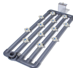
mit Untergestell + Spülwasseraufbereitung