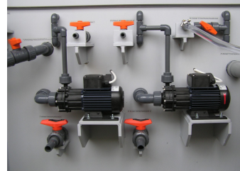
Anschlüsse SPRINT3000 lang