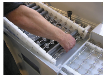
Transport ↑ Düsenstock ↓

Jederzeitige technische Änderung vorbehalten.